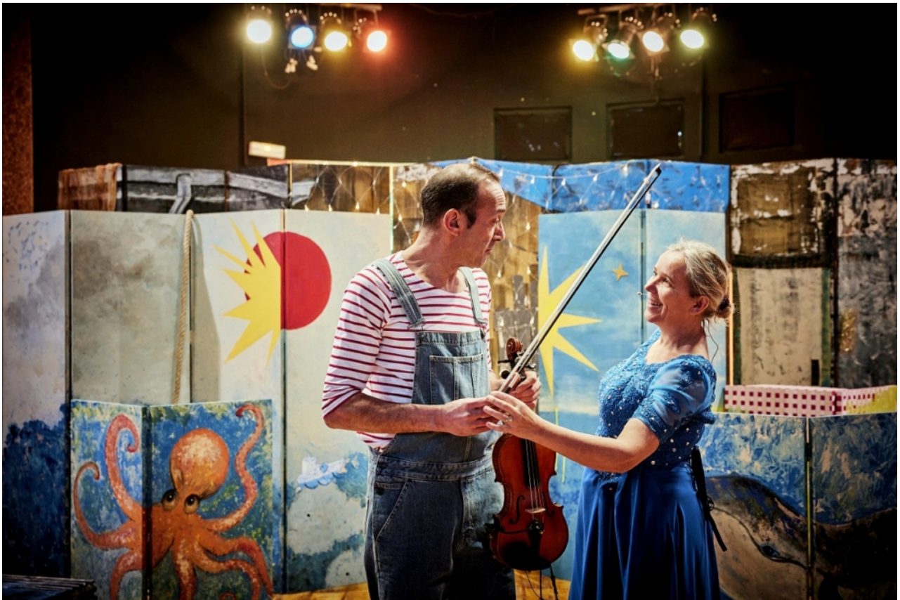
Malik le Magnifik® Christophe Raynaud de Lage

Avec six créations, la 14 ème édition de la biennale Odyssées en Yvelines du CDN de Sartrouville affirme une identité très pluridisciplinaire avec une dominante : une relation forte au réel. Ce qui pose de riches questions quant aux objectifs et aux possibles de la création à destination de l'enfance et de la jeunesse.