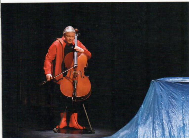
Esquif (à fleur d'eau) (2024).