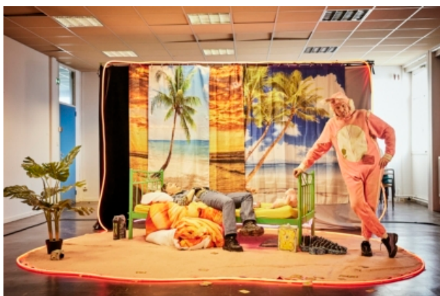
Love-a-gogo

décalsés : un grand « Lapinou » tout sale parce qu'abandonné de longue date par Swan, 14 ans, et la mère de