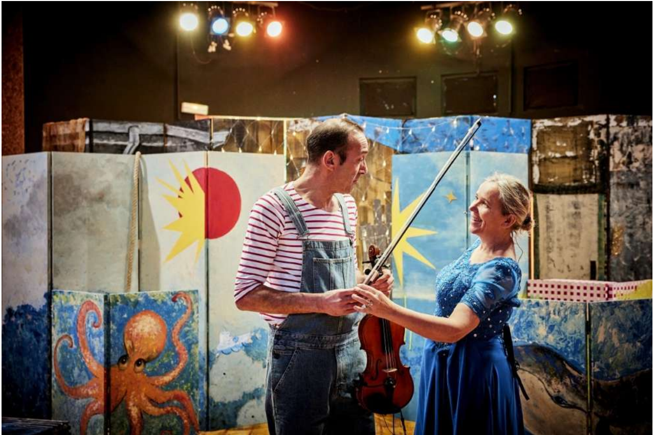
Malik le Magnifik® Christophe Raynaud de Lage

Avec six créations, la 14 ème édition de la biennale Odyssées en Yvelines du CDN de Sartrouville affirme une identité très pluridisciplinaire avec une dominante : une relation forte au réel. Ce qui pose de riches questions quant aux objectifs et aux possibles de la création à destination de l'enfance et de la jeunesse.