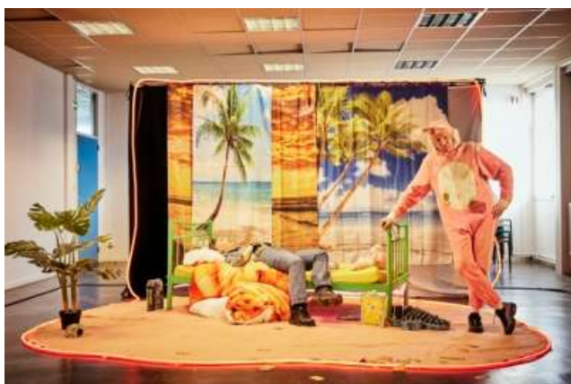
Love-a-gogo